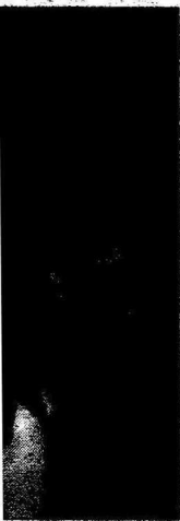
fără Mister, sortină

scena Teatrului ▶ tinerii nete cu teme variate